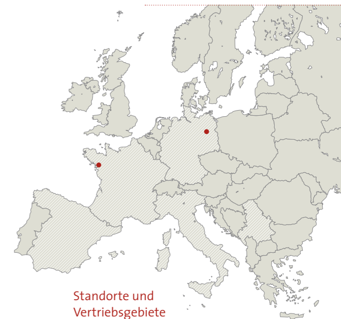
Standorte und Vertriebsgebiete

Die Sonne effizient und wirtschaftlich zu nutzen, ist unser Anspruch.